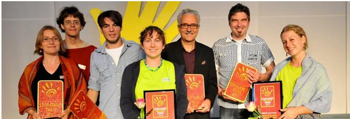
Die Gewinner der Preise in den Kategorien Persönlichkeit, Kreativität, Projekte und Predigt. Details siehe unter www.stoparmut2015.ch/aktionen/stoparmut-preis/gewinner-2010

Mit dem StopArmut-Preis wurden auch dieses Jahr Persönlichkeiten und Werke für ihr Engagement zugunsten der Armen gewürdigt.